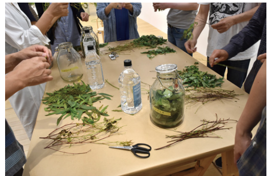
「リサーチワークショップ・公開ミーティング vol.05」2019

日時 | 11.2 (土) 15:00-17:00 ※要ブリッジパス 会場 | 港まちポットラックビル 定員 | 15名 (予約不要) 協力 | アートラボあいち