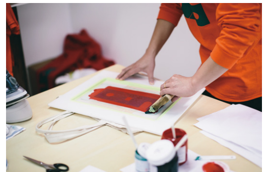
《Useful Copied Objects》2018

日時 | 11.9 (土)、10 (日) 13:00-18:00 会場 | NUCO 講師 | フクナガコウジ (デザイナー / UCO・NUCO ロゴデザイン) 参加費 | 1点につき 500円から (別途生地代がかかる場合があります。)