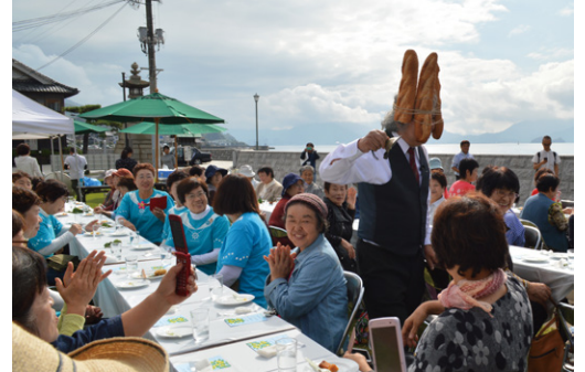
《50人の島のおばあさんのランチ》2017

日時 | 10.8 (火) ※要ブリッジパス (* 時間などの詳細は後日ウェブサイトで発表します) 会場 | ガーデンふ頭臨港緑園 定員 | 一般の方の参加は見学のみになります