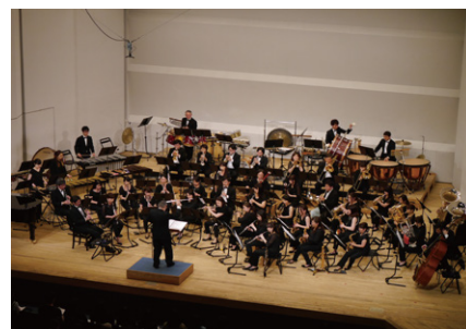
名古屋アカデミックウインズ

11.4 (月・祝) 13:00-13:30 コンサート / 14:00-15:00 楽器体験会 会場 | ららぽーと名古屋みなとアクルス 3F ららスタジオ 出演 | 名古屋アカデミックウインズメンバーによるアンサンブル