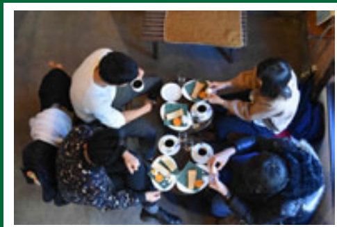
▲アッセンブリッジ・ナゴヤ 2016 LPACK. によるモーニングの様子