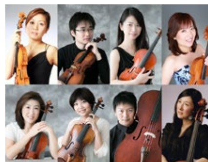
渡辺美穂 × 名古屋のオーケストラ奏者による弦楽八重奏