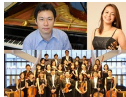
野田清隆(ピアノ・指揮) × 愛知室内オーケストラ