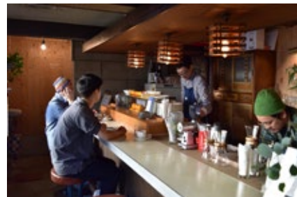
L PACK. 《たとえば、いつもより早く起きて港街でモーニングを食べてみるとする。》 アッセンブリッジ・ナゴヤ2016