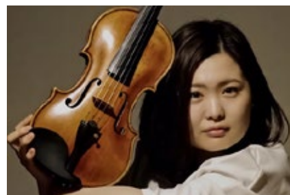
安田祥子 潮風ブレンド・コンサート