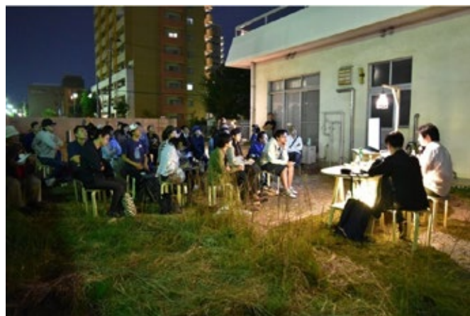
地域美学スタディ