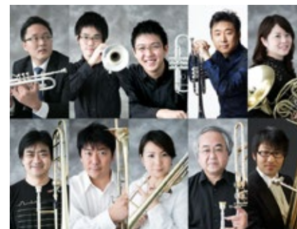
名古屋フィルハーモニー交響楽団 金管十重奏コンサート