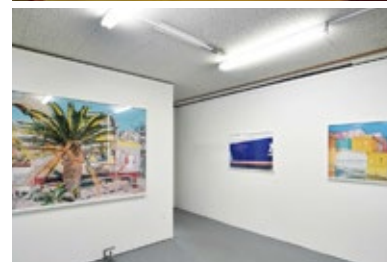
アッセンブリッジ・ナゴヤ 2016 の様子

アッセンブリッジ・ナゴヤは、2016年よりスタートし、名古屋の港まちを舞台にしたクラシック音楽と現代美術のフェスティバルです。[アッセンブリッジ assemble]とは、「集める」「組み立てる」などの意味をもつ[アッセンブル assemble]と、[ブリッジ bridge]を組み合わせた造語です。音楽やアートが架け橋となり、まちと人が出会い、つながりが生まれ、新たな文化が育まれていくことを目指しています。