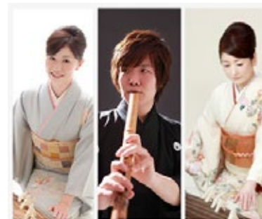
Koto〜ひらり〜 和のひととき