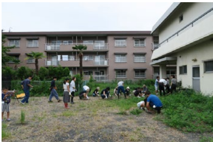
みなとまちガーデンプロジェクト