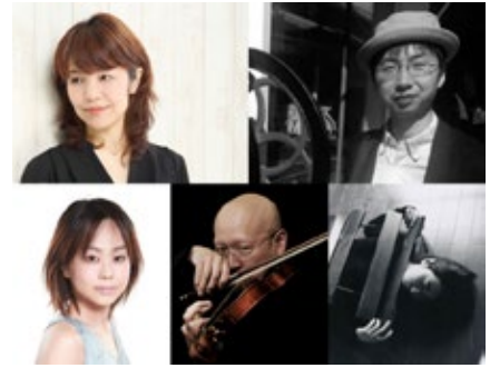
みなとまちコンテンポラリー・ミュージックコンサート みなとの永い夜