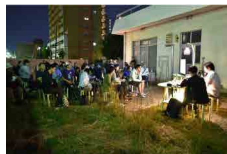
地域美学スタディ