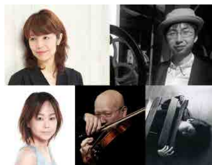
みなとまちコンテンポラリー・ミュージックコンサート みなとの永い夜