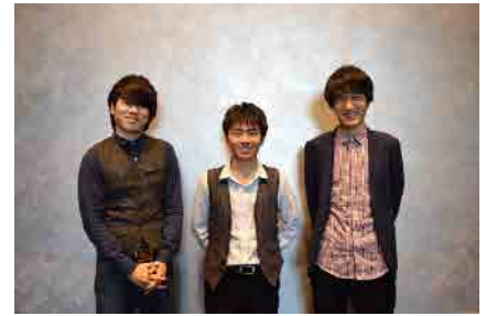
平手裕紀トリオ ジャズ・コンサート