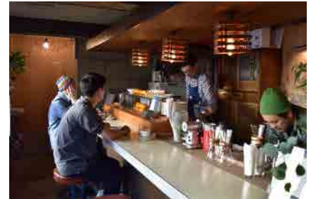
L PACK.《たとえば、いつもより早く起きて港街でモーニングを食べてみるとする。》 アッセンブリッジ・ナゴヤ2016