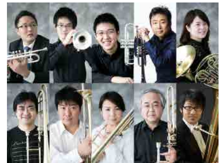
名古屋フィルハーモニー交響楽団 金管十重奏コンサート