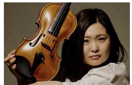
安田祥子 潮風ブレンド・コンサート