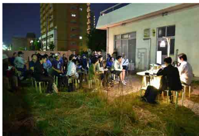
地域美学スタディ