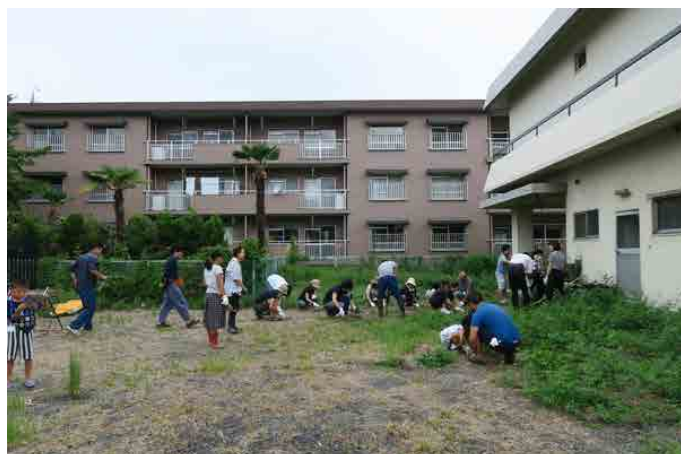
みなとまちガーデンプロジェクト