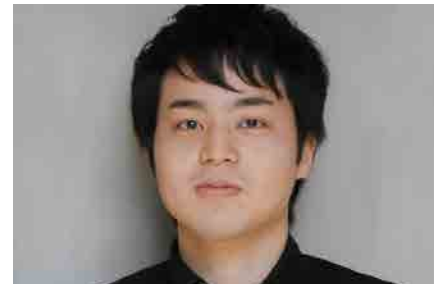
山中惇史 ピアノ・リサイタル