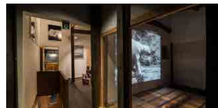
KYOTO ART HOSTEL Kumagusuku

定員 | 30名(予約不要) 料金 | 無料(展覧会パスポートが必要になります)