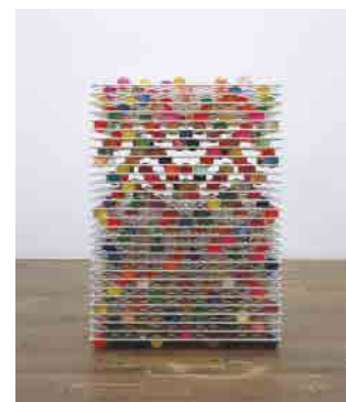
富井大裕(ball sheet ball)2006