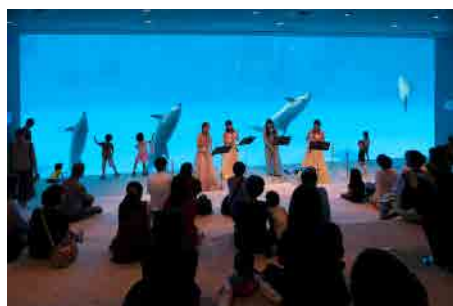
名古屋港水族館でのコンサートの様子(2016)