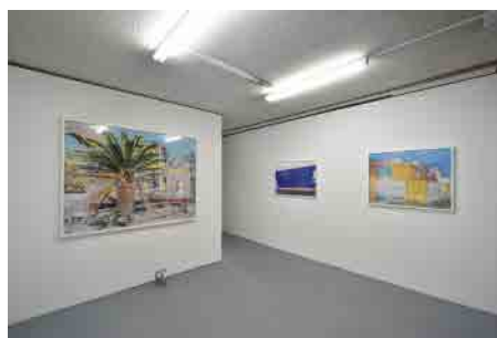
アッセンブリッジ・ナゴヤ2016 展覧会様子(2016)