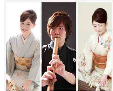
Koto〜ひらり〜 和のひととき